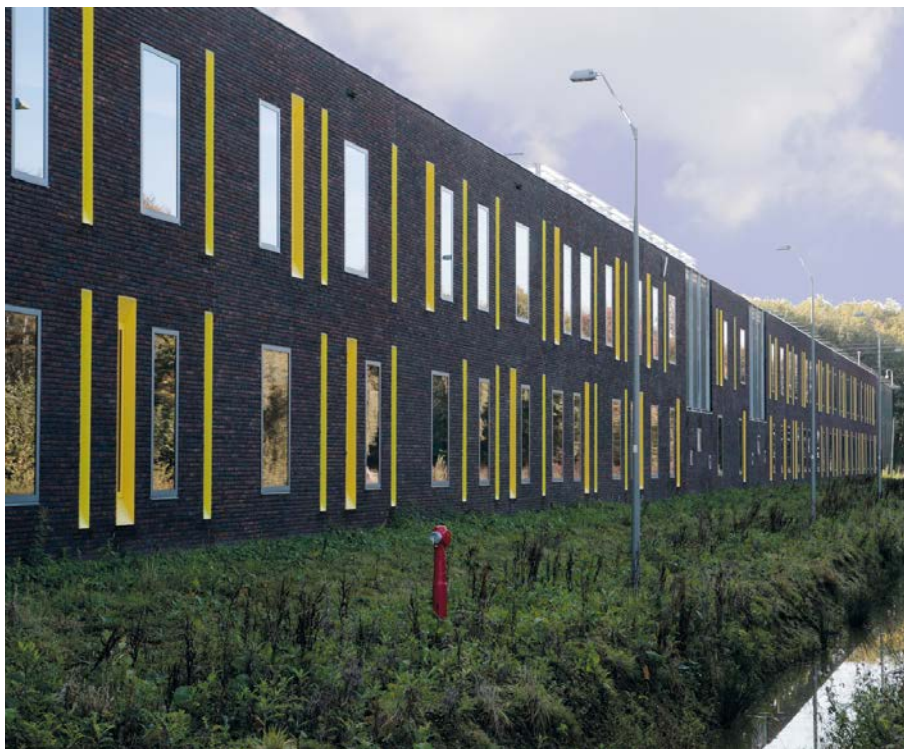
De Woenselse Poort.