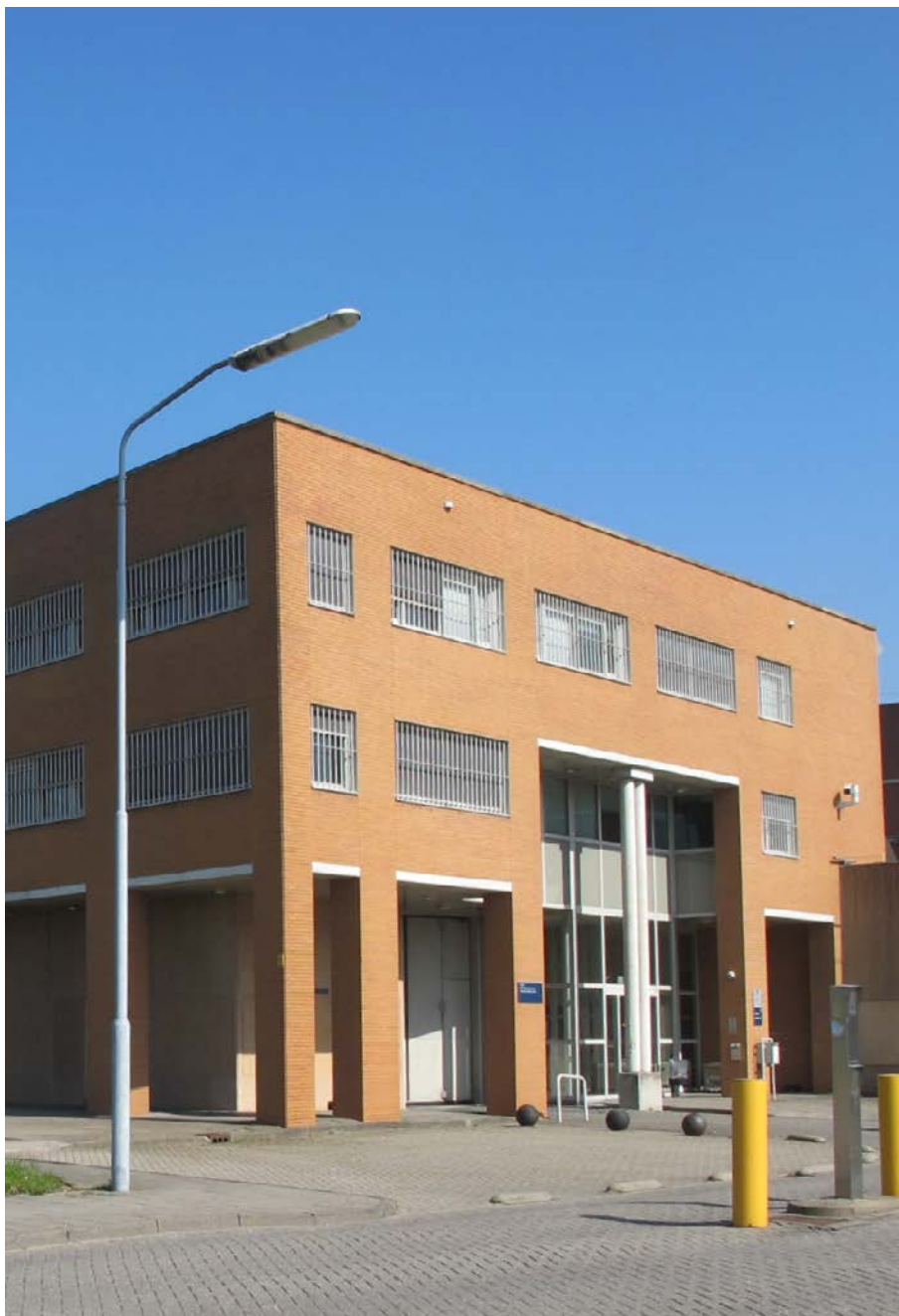
PI Dordrecht.